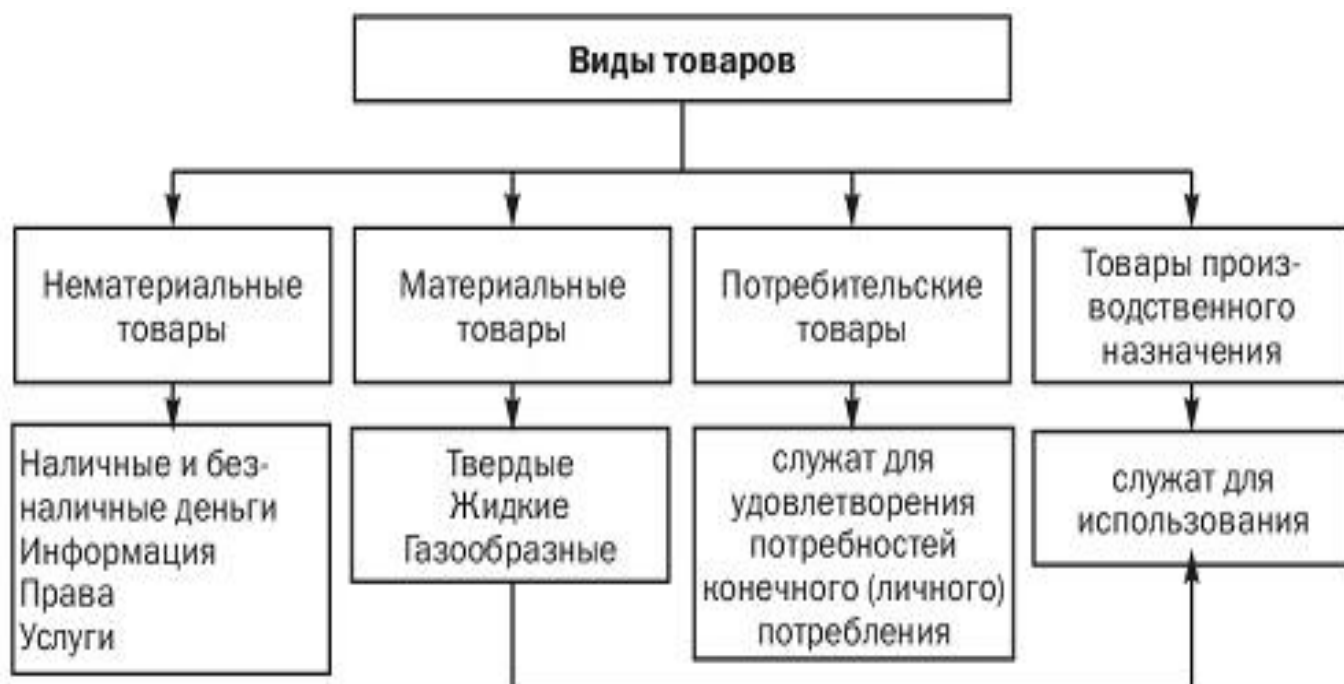
Рисунок – Виды товаров

Причем не каждый продукт труда выступает в качестве товара, а только тот, который предназначен для обмена, продажи, передачи кому-либо с условием возмещения усилий и затрат на его производство (например, изготовленный хозяином для своей кухни стул не является товаром, но он станет таковым, если будет передан соседу на каких-либо условиях компенсации).